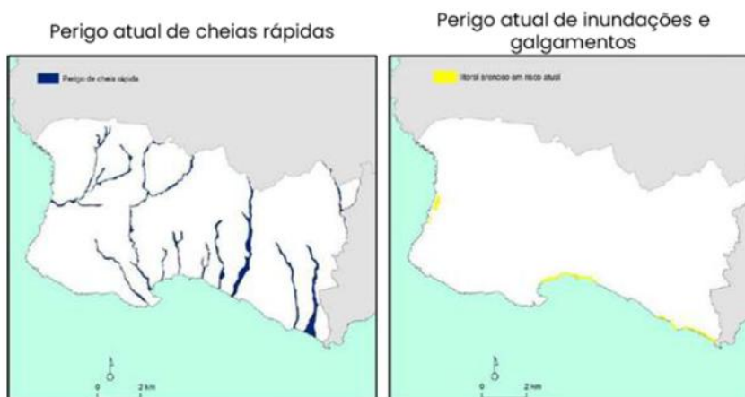
Fig. 27 in CMC, 2025, pág. 70

Realçamos ainda que no mais recente Plano Municipal de Ação Climática da autarquia de Cascais, estão identificados em Carcavelos e Parede a) risco moderado de erosão do litoral arenoso e b) risco elevado de cheias rápidas (págs. 69 e 70), referindo que “estas ameaças apresentam atualmente uma expressão significativa e tendem a agravar-se nas próximas décadas, sendo consideradas as mais críticas para o território” (pág.70).